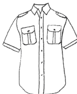
Koszula z krótkim rękawem