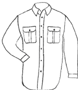
Koszula z długim rękawem