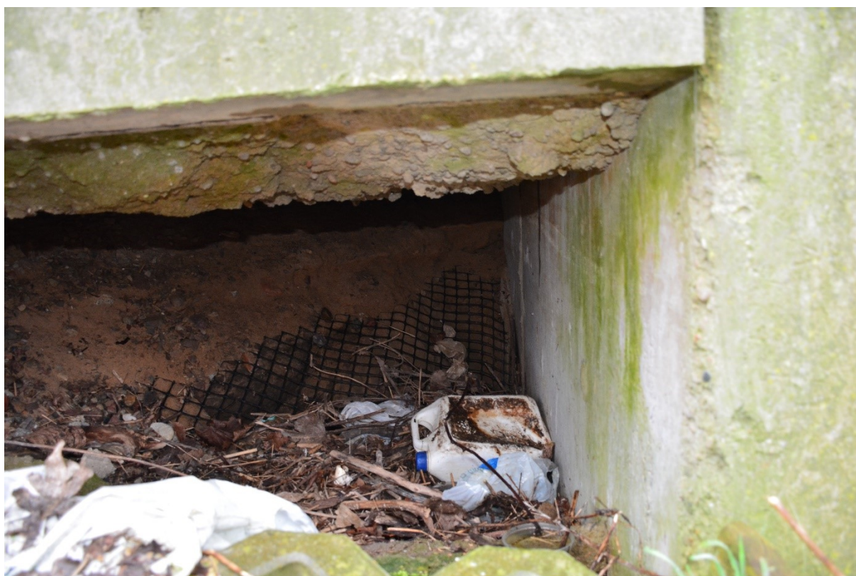
Fotografia powyżej : Widok na wnękę – „jamę” powstałą na skutek zniszczenia okładziny skarpy i wypłukania podbudowy nawierzchni Nabrzeża Parkowego (część 1).