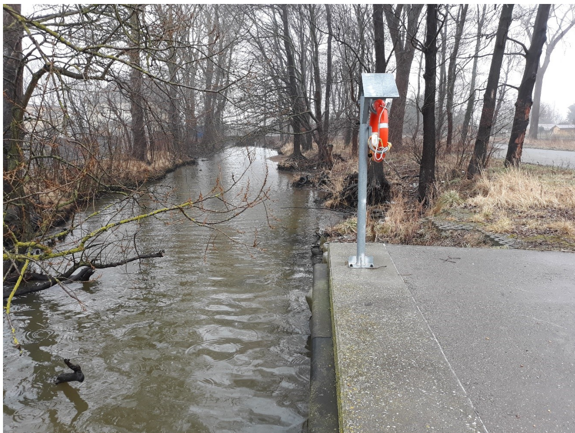
Fotografia powyżej i poniżej : Widok na oczepek żelbetowy na przedłużeniu którego należy od nowa ułożyć umocnienie z geokontenerów (część 1)