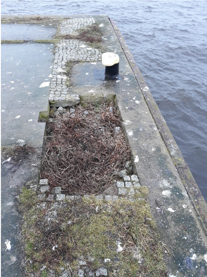
Fotografia powyżej i poniżej : Widok na miejscowy brak nawierzchni Nabrzeża Postojowego do uzupełnienia wraz z podbudową (część II)