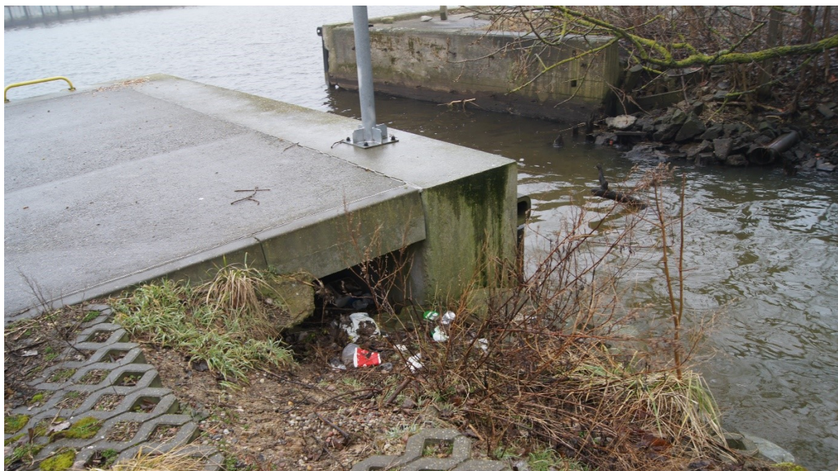
Fotografia powyżej : Widok na uszkodzone zakończenie Nabrzeża Parkowego na styku z ciekim wodnym wpływającym od wschodu do Kanału (rzeka Wieprza)